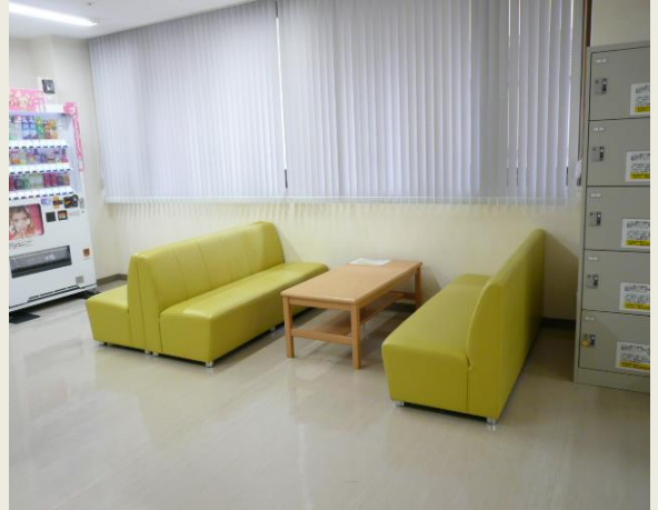
家族控室 (ICU・HCU・救命センター病棟共通)